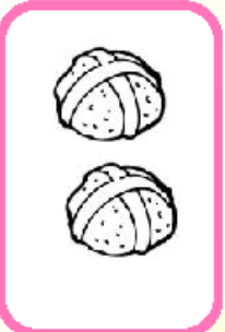
Hot Cross Buns